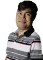
Ahad Küche Afghanistan

„... wo er ist, geht der Rauch auf“ bei uns seit 2018