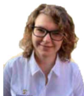
Elena Service/Rezeption Italien

„Essen ist wichtig, Lachen aber mindestens genauso“ - im Dollinger aufgewachsen