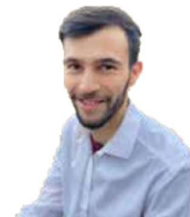
Kazem Service Afghanistan

„vom Dach der Welt ins „Flachland“ Tirol - seit 2021 eine Bereicherung