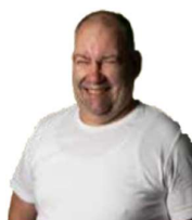
Andi Service Innsbruck

„Goldener Mensch“ - seit 2004 unersetzlich