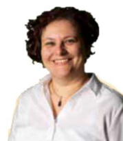
Ulli Rezeption Innsbruck

„Du kannst nicht alle glücklich machen - du bist keine Schokolade“ Verstärkt seit 2021 unser Team