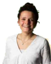
Helena Service/Rezeption Innsbruck

„Haushexe“ schafft einfach alles und das seit 1998