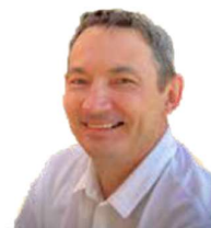
Momo Küche Serbien

„Unsere voll motivierte Errungenschaft“ - seit 2021 Teil unseres Teams