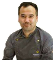
Hassan Küche Afghanistan

„Unsere voll motivierte Errungenschaft“ - seit 2021 Teil unseres Teams