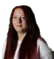
Nici Küche Innsbruck

„... alles unter Kontrolle“ - und das seit 2015