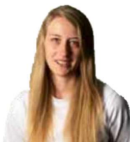
Sabi Küche Innsbruck

„Unser Duracell-Hase“ seit 1992 unersetzlich