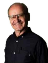
Edi Konditor Kärnten

„Unser Duracell-Hase“ seit 1992 unersetzlich