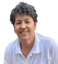
Dragica Küche Serbien

„Ich schaffe das, kein Problem“ Hat 2018 bei uns seine Lehre begonnen und diese erfolgreich abgeschlossen