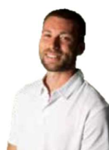
Sladi Service Serbien

Unser fleißiger Lehrling - seit 2022 im Service