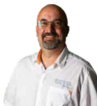
Tom Chef/Bar Innsbruck

„Offen und neugierig durch die Welt“ - im Dollinger aufgewachsen