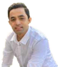
Suresh Service Nepal

„Für mich ist alles kein Problem“ - seit 2018 dabei